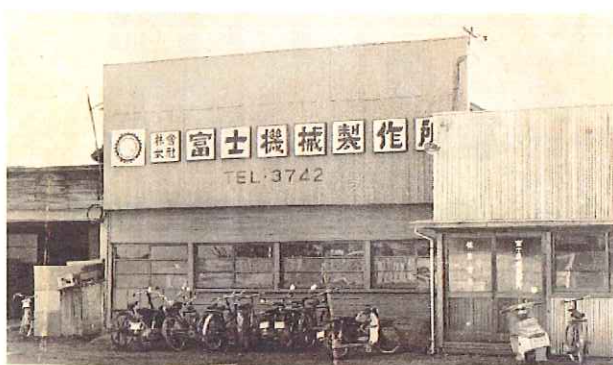
創業当時の社屋(福岡県大川市小保)