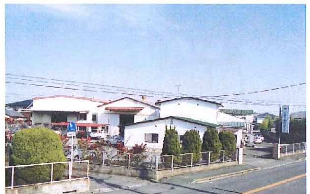
現在の社屋(佐賀県諸富町)